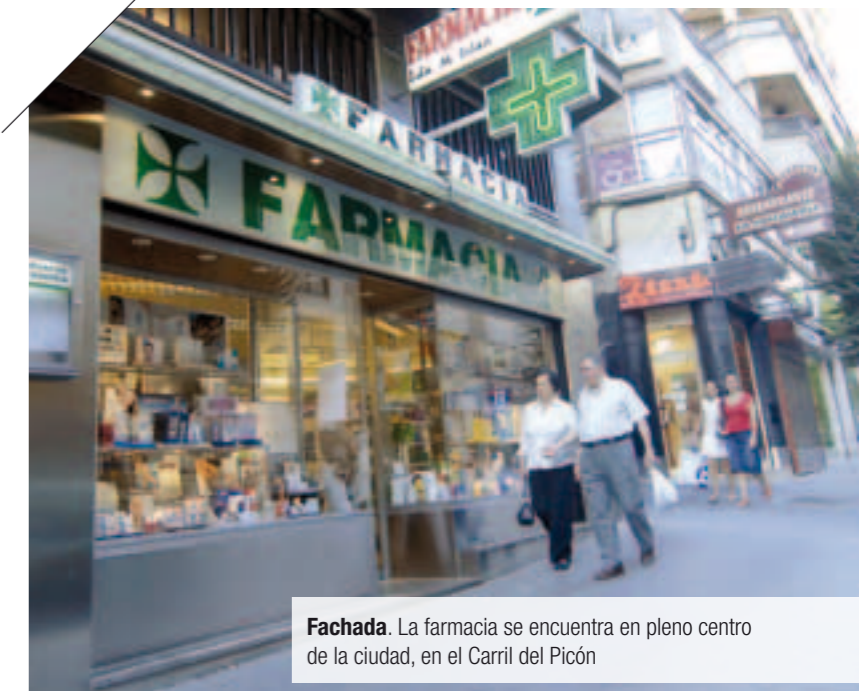
Fachada. La farmacia se encuentra en pleno centro de la ciudad, en el Carril del Picón

enfermedad. Se plantea alguna que otra reforma para garantizar la seguridad en el trabajo ya que ha sido víctima de varios atracos pero poco más. "Supongo que mis hijos se quedarán aquí cuando yo me jubile y serán ellos los que tomen las riendas y harán lo que quieran". Por ahora, ella está a pleno rendimiento. Su farmacia, la filosofía, su pasión por la patrona de Andújar (la Virgen de la Cabeza) y su familia le ocupan, con gusto, todo su tiempo.