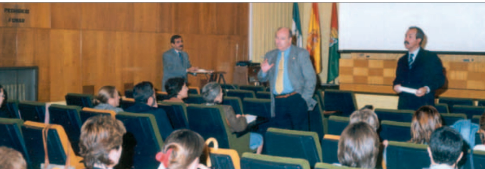
TEXTO: GRANADA FARMACÉUTICA